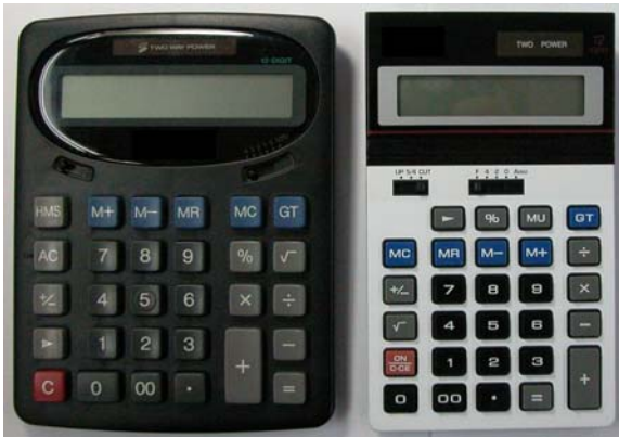
簡易型計算器圖例